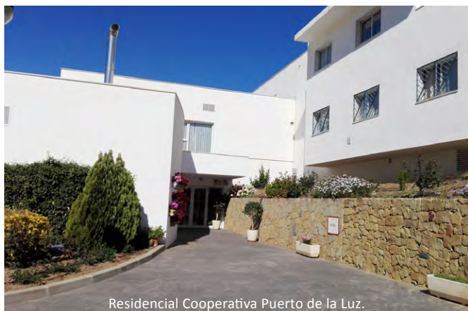
Residencial Cooperativa Puerto de la Luz.