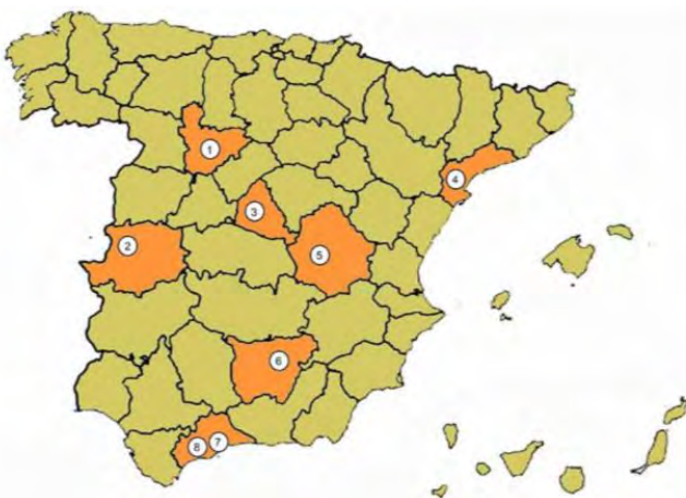
Figura 1. Mapa cohousing senior España

Nota: 1.Profuturo; 2.La Muralleta; 3.Trabensol; 4.Servimayor; 5.Convivir; 6.Fuente de la Peña; 7.Los Milagros; 8.Puerto de la Luz.