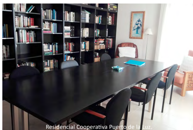
Residencial Cooperativa Puerto de la Luz.