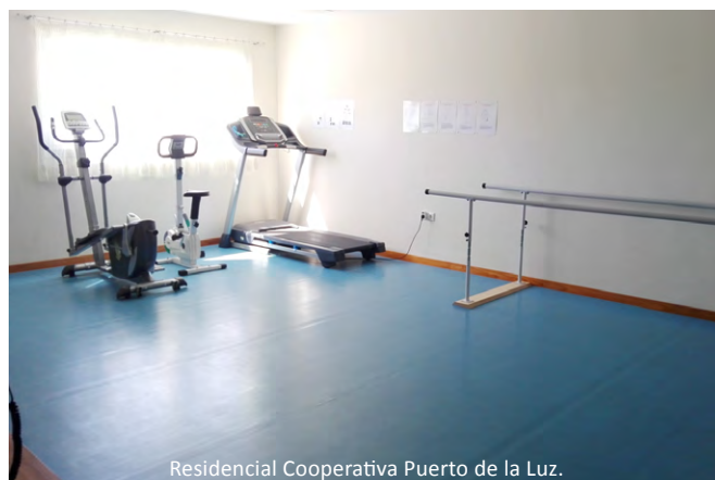
Residencial Cooperativa Puerto de la Luz.