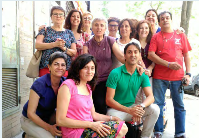
Equipo de Trabajadoras Sociales del Distrito Sanitario Atención Primaria de Sevilla.

Se les facilita un espacio para compartir experiencias y reflexionar acerca de cómo enfrentan sus vivencias y dificultades, de los temas que se van exponiendo son: los activos personales y comunitarios, comunicación asertiva, obstáculos y habilidades, metas y objetivos, distorsión en los pensamientos, influencia de los pensamientos negativos en su salud, la resolución de problemas y conflictos, la percepción, la autoestima, la gestión de las emociones y el manejo del estrés y la ansiedad. Todo ello con un apoyo y entrenamiento en técnicas de relajación, además de apoyo con material audiovisual, dinámicas grupales, con el objetivo de