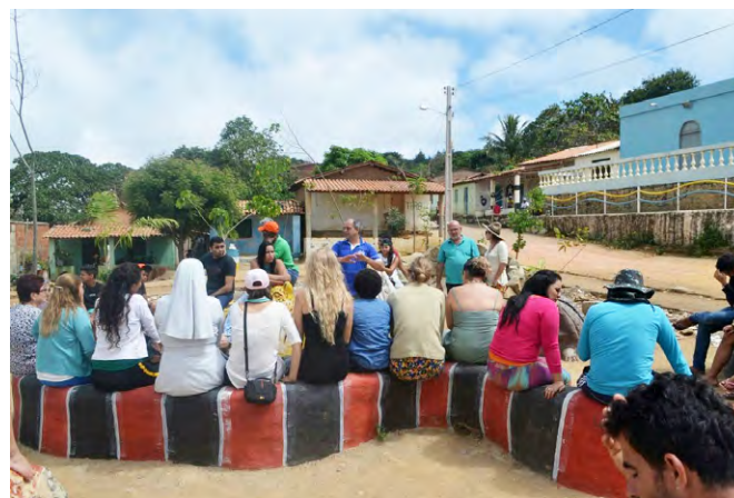
Reunión con los representantes de la comunidad sobre sostenibilidad (Núcleo).