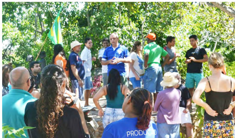
Clases de formación en Permacultura.

Una vez implantado el NAE, todas las acciones de autogestión van dirigidas al fortalecimiento de la identidad del lugar, respetando su cultura, sus costumbres y profundización en el trabajo de concienciación sobre la persona y su vida, desde el dialogo ya que todas las decisiones se gestionan en el grupo.