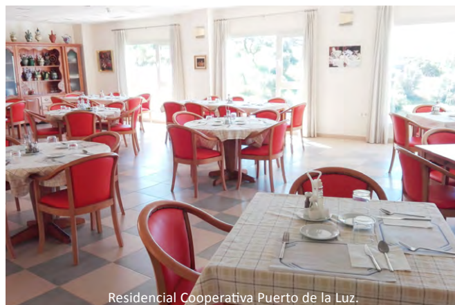
Residencial Cooperativa Puerto de la Luz.