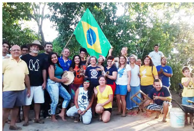
Encuentro de convivencia entre participantes del proyecto.

Los objetivos del proyecto N.A.E. es promover el desarrollo humano y comunitario partiendo de acciones sociales, culturales, ambientales y creativas planteadas por el núcleo. Entendiendo como núcleo, un espacio de encuentro y fortalecimiento de la