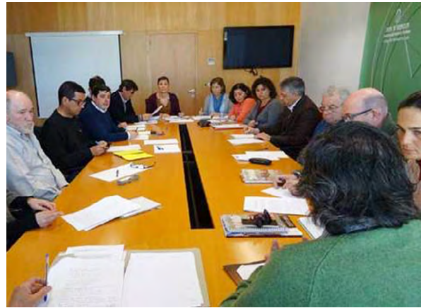
Momento de la primera reunión de la Mesa Tripartita.

Esperamos que este curso pueda ser una aproximación y toma de contacto y que desde el Trabajo Social podamos seguir formándonos y aprendiendo en estas materias para atender y paliar este drama humano que estamos viviendo con el fin de cumplir con los derechos humanos.