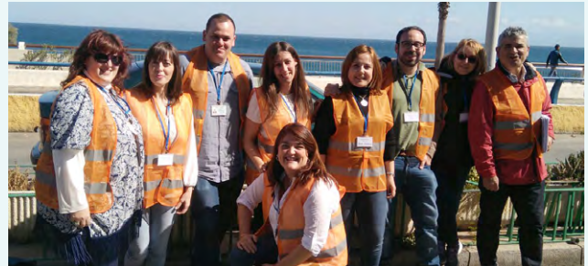
Asistentes al simulacro en la ciudad autónoma de Ceuta.