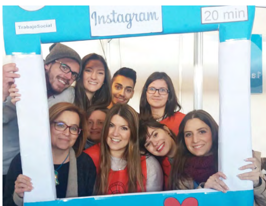
Miembros de la Junta de Gobierno del CPTS-HUELVA junto a asistentes de la Jornadas de Puertas Abiertas de la UHU.

El colegio Profesional de Trabajo Social participa en la XVI Jornadas de Puertas Abierta de la Universidad de Huelva.