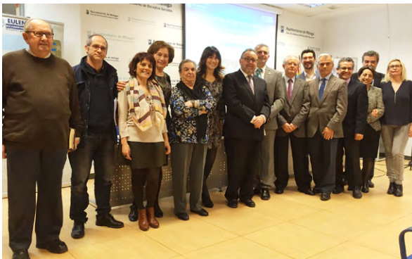
Algunas de las autoridades asistentes a las jornadas.

Las personas asistentes en representación del Colegio de Málaga, 13 en total, colaboraron en la identificación de los recursos sociales en el seísmo de nivel 2 y ante una emergencia de interés nacional junto a la Unidad Militar de Emergencia (UME).