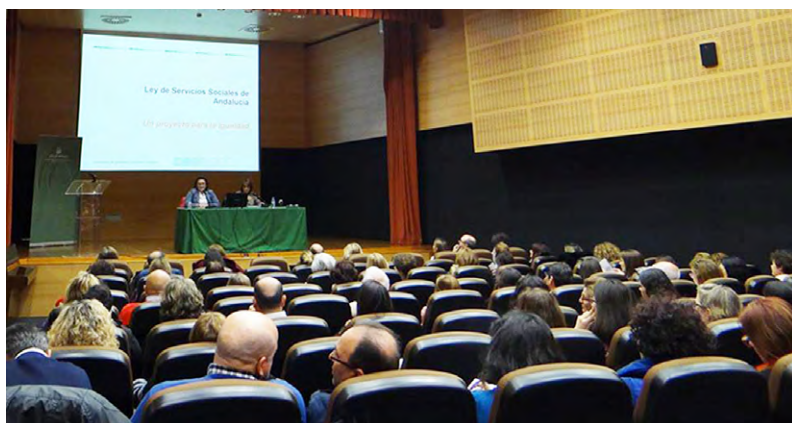
Acto de presentación del proyecto de Ley de Servicios Sociales de Andalucía.

El encuentro, con carácter preparatorio, ha antecedido a la celebración, en el mes de abril, de un simulacro de sismo en Andalucía y Ceuta. Para ello, el Consejo Andaluz de Trabajo Social ha contado con la participación de medio centenar de trabajadores sociales andaluces, ya inscritos como voluntarios y voluntarias.