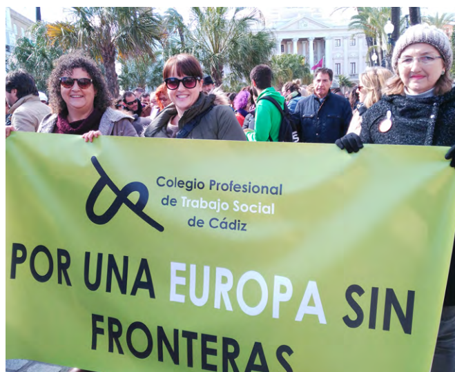
Participación del Colegio de Cádiz en la Manifestación.

La Asociación Pro Derechos Humanos Andalucía (APDHA) manifestó que aunque Europa indique que “está desbordada” Turquía acoge a dos millones de personas refugiadas sirias. Si Europa acogiera tantas personas como Turquía, sería un refugiado por cada 250 habitantes. Pero Líbano acoge a una persona por cada 4 habitantes y no se ha declarado “desbordado”.