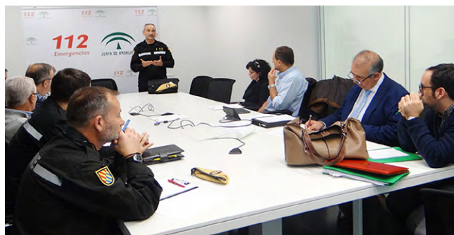
Reunión con equipo psicosocial de la UME.