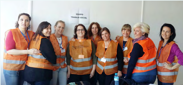
Colegadas asistentes al simulacro en el aeropuerto San Pablo de Sevilla.