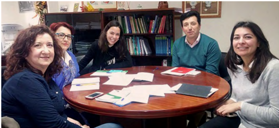
Miembros de la Comisión de Mediación del CPTS-HUELVA y profesionales del Servicio de Familia de la Delegación Territorial de Salud, Igualdad y Políticas Sociales de la Junta de Andalucía.

Miembros de la Junta de Gobierno del CPTS-Huelva se han reunido con el equipo del Servicio de Familia de la Delegación Territorial de Salud, Igualdad y Políticas Sociales.