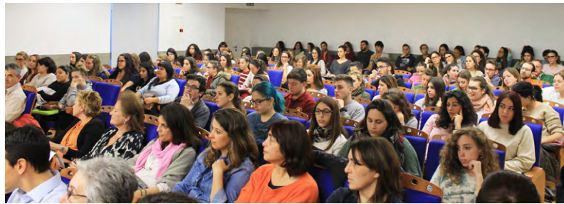
Vista general de la sala.