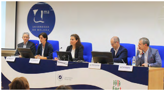
Autoridades asistentes al acto en la FESTA.