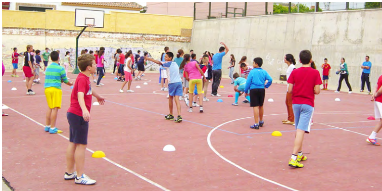
Dinámicas de conocimiento, interacción y cohesión grupal en el IES Ilipa Magna de Alcalá del Río (Sevilla).

tivas especiales, compensación educativa y apoyo a la función tutorial del profesorado, actúan en el conjunto de los centros de una zona educativa (Decreto 213/1995, de 12 de septiembre de 1995, por la que se regulan los equipos de orientación educativa). Es indiscutible que dichas unidades y en los departamentos de orientación de los IES constituyen un eslabón importante para asegurar el derecho a la educación en igualdad con independencia de diversos factores y circunstancia que puedan afectar a los menores aunque en muchas ocasiones resulta llamativo la escasa presencia y el papel secundario del trabajador social en estos equipos teniendo en cuenta la enorme importancia de la intervención con la familia y/o tutores y el entorno cercano. Así en este sentido desde estos dispositivos de orientación educativa con