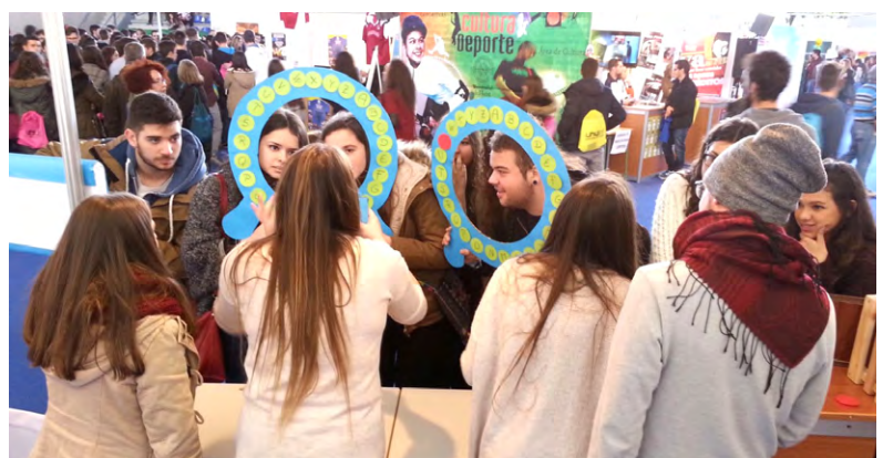
Voluntarios de la Facultad de Trabajo Social realizando dinámicas informativas a los asistentes a las Jornadas de Puertas Abiertas de la UHU.