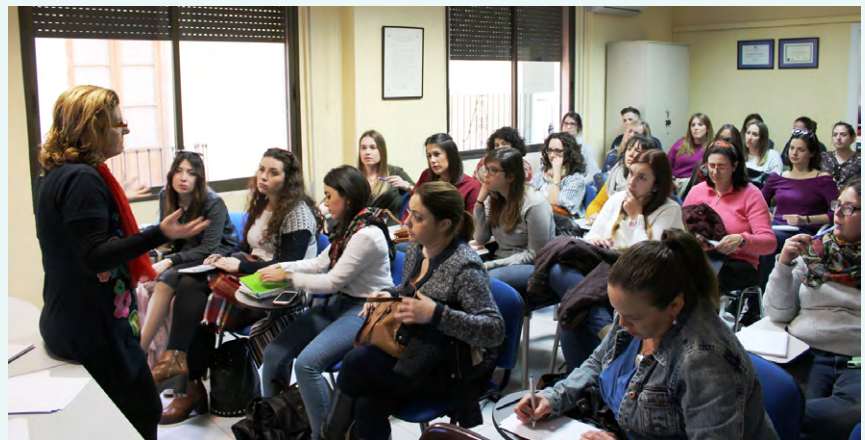
Charla informativa sobre metodología del próximo curso de oposiciones del CODTS Málaga.

Explicamos desde la metodología a seguir, el entrenamiento preciso por parte de las personas que decidieran inscribirse, la optimización de recursos