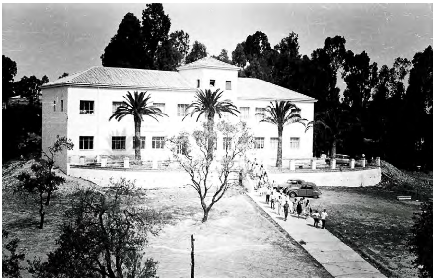
Escuela de Asistentes Sociales, calle Diego Velázquez.

Ya cuando estudiaba era una profesión totalmente desconocida, pero cuando comencé a trabajar aprecí aún más ese desconocimiento, hablamos de 1971, donde en Huelva sólo había tres asistentes sociales ejerciendo. Al comienzo de mi primer puesto de trabajo, en el Psiquiátrico de Huelva, éramos dos Asistentes Sociales, recuerdo que nos ocurrió una cosa bien graciosa y curiosa: “nos llamó uno de los responsables del personal para enseñarnos unos muestrarios de tela, con objeto de que eligiéramos la tela de los uniformes. Estos muestrarios eran de los uniformes del Personal de Servicios y limpieza del Hospital” , este hecho refleja claramente el desconocimiento de la profesión en aquellos momentos. Evidentemente los profesionales sanitarios responsables de la puesta en marcha del Hospital, psiquiatras, si conocían, y bien, nuestro rol.