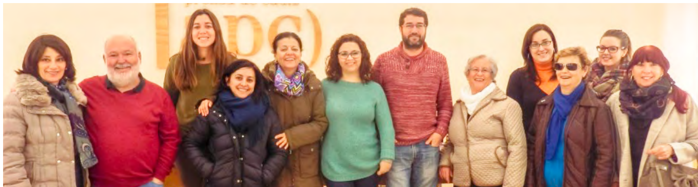
Convocatoria de la Manifestación del 27 de febrero.