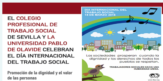
Cartel anunciador de la Celebración del Día Internacional del Trabajo Social.

Con el objetivo general de promover la dignidad y el valor de las personas, el Colegio Profesional de Trabajo Social de Sevilla y la Universidad Pablo de Olavide han celebrado conjuntamente -durante el mes de marzo de 2016- el Día Internacional del Trabajo Social (15 de marzo). Para ello se ha desarrollado un amplio programa de actividades en torno a dicha fecha, el cual incluye un ciclo de cine-forum social,