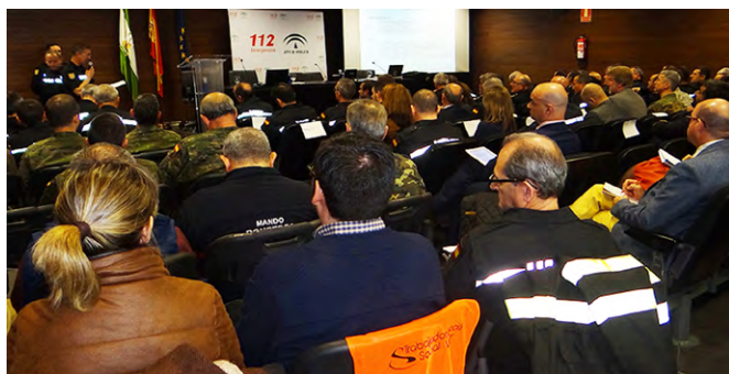
Reunión con la Unidad Militar de Emergencias.