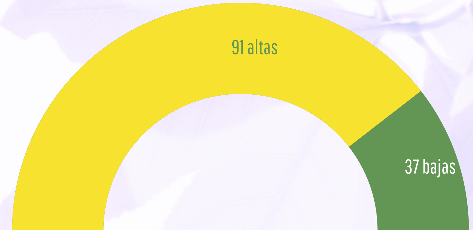
Gráfica 1: Altas y bajas colegiales en el ejercicio 2024.

En la siguiente grafica se detalla la evolución de la colegiación en este año: